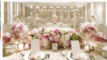
Royale Blanc (ロワイヤルプラン)